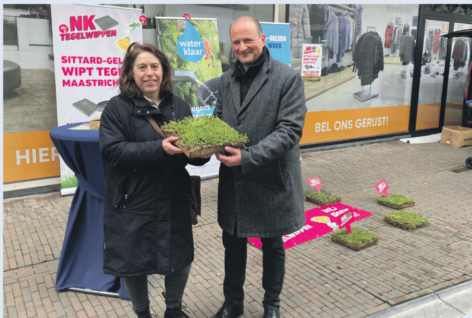
De stand van Waterklaar op St. Joepmarkt was vorig jaar een groot succes. Ook dit jaar kunt u hier weer terecht voor advies en hulp.

Op een regenachtige ochtend in februari nam het college het besluit om de subsidieregeling voor het afkoppelen van regenwater te verlengen tot 2027. Dat is goed nieuws voor alle inwoners die maatregelen willen nemen om te voorkomen dat schoon regenwater in het riool terechtkomt. Met die maatregelen voorkomen we wateroverlast en bewaren we water voor droge periodes.