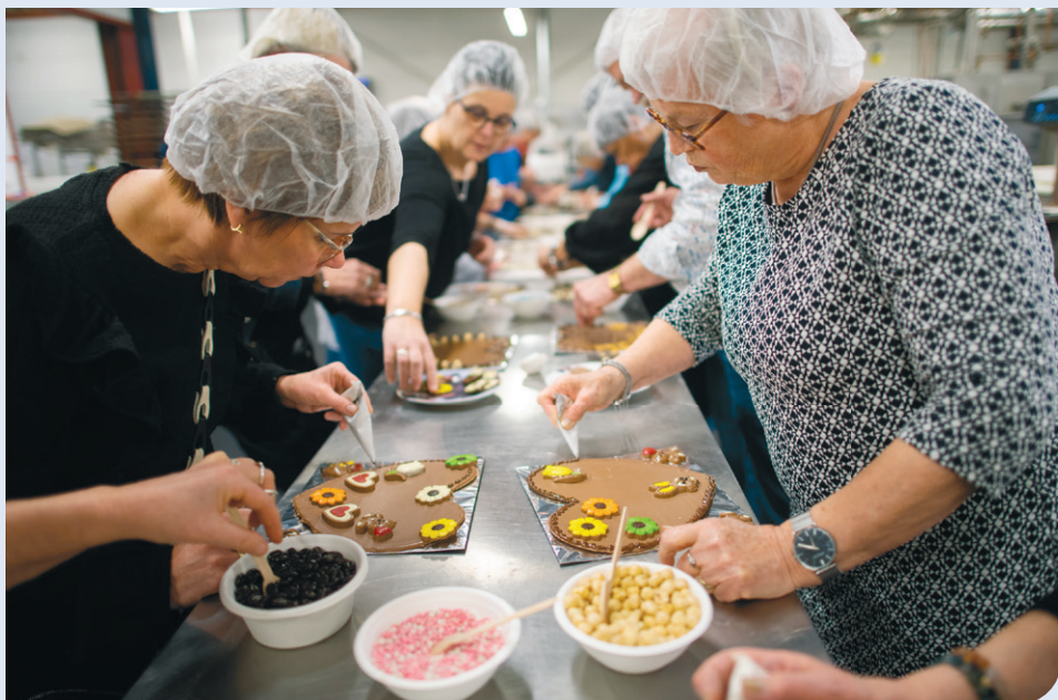
Vrijwilligers kunnen kiezen uit veel activiteiten tijdens het vrijwilligersweekend.

In dat weekend doen we iets terug voor de mensen die het hele jaar door iets voor ons allemaal doen.