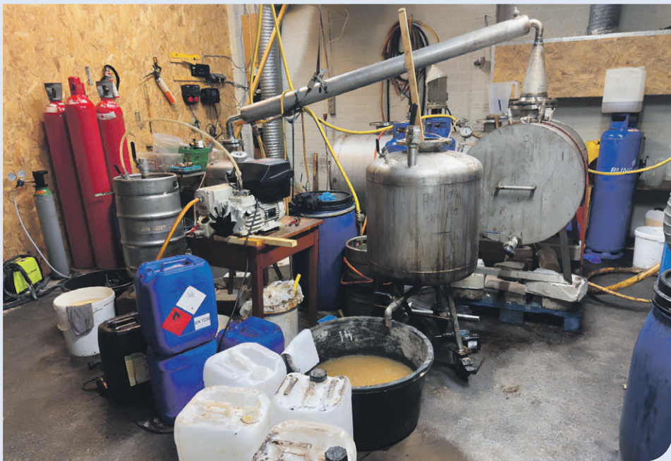
Het drugslab dat een tijdje geleden in de Gadéstraat in Geleen werd opgerold.

Een tijdje geleden was in de Hanenhof in Geleen een bewonersavond voor de mensen die in de buurt van de Gadéstraat in Geleen wonen. In deze straat ontdekten we kort geleden een drugslab. Samen met de politie gaven we informatie over wat er precies is gevonden en beantwoordden we de vragen van de bewoners.