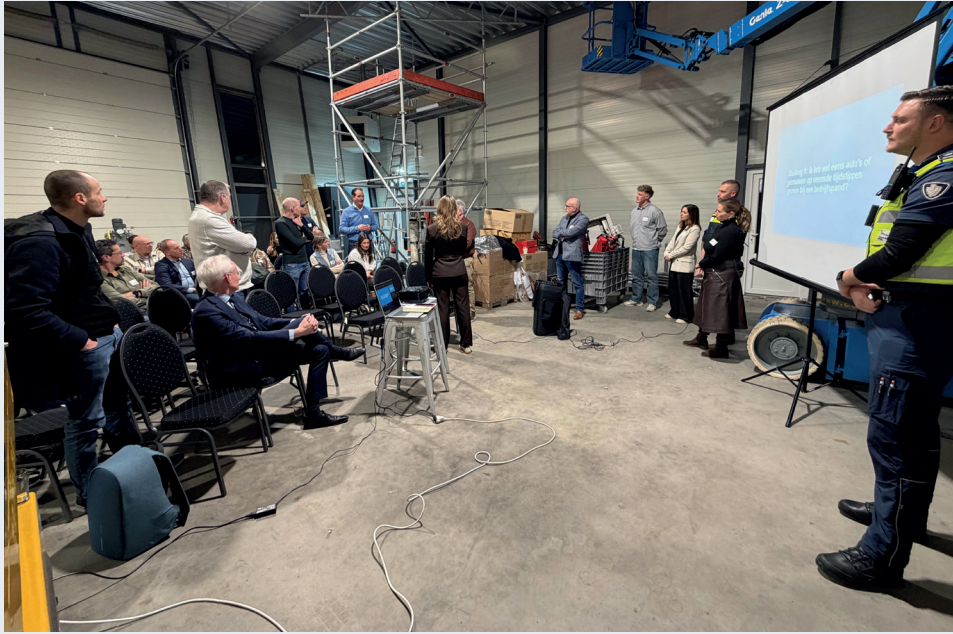
Een avond met ondernemers, politie en gemeente over veiligheid op bedrijventerreinen.

Veilig ondernemen is heel belangrijk in Sittard-Geleen. Daarom geeft de gemeente hier veel aandacht aan, bijvoorbeeld met speciale avonden voor ondernemers. Ook het Keurmerk Veilig Ondernemen wordt binnenkort opnieuw aangevraagd en waarschijnlijk in april toegekend. Dit is een belangrijke stap om de veiligheid verder te verbeteren voor iedereen in onze gemeente.