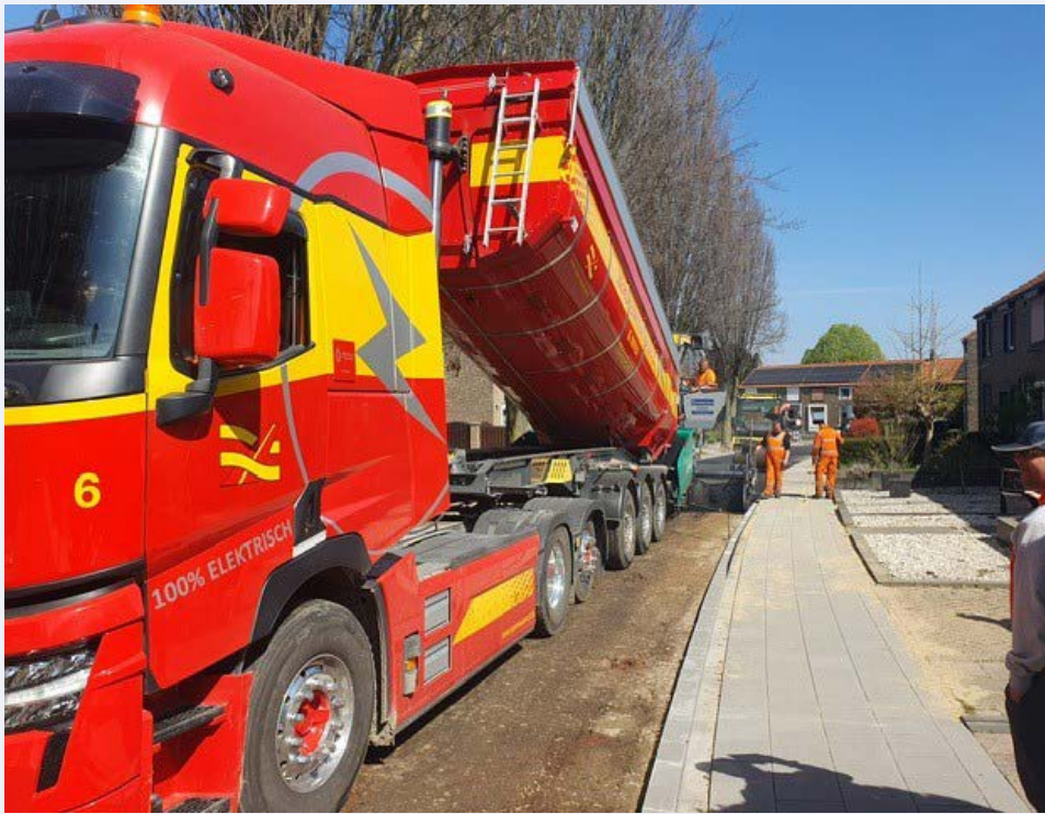
Bij het groot onderhoud van onze wegen wordt gewerkt met elektrische vrachtauto's.

We werken hard aan betere wegen én een schonere leefomgeving. Sinds 2025 zijn al heel wat wegen vernieuwd waarbij we hebben ingezet op werken zonder schadelijke uitstoot. Dat noemen we emissieloos werken. Dat betekent zo veel mogelijk werken met elektrisch materieel.